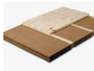
dřevovláknitá izolační deska